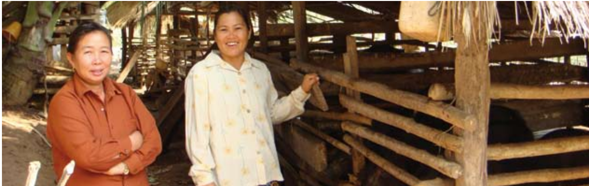
ແຍ້ງໄດ້ແນະນຳໃຫ້ໃຊ້ອາຫານສັດພ້ອມດ້ວຍອາຫານເສີມທີ່ໃຊ້ລ້າງໃນຄອກທູມໃນໝູ່ບ້ານ

a ຂີດຄວາມສາມາດທາງດ້ານລາຄາທີ່ມີຄວາມສະເໝີພາບໃນການຊື້ (ເບິ່ງຜະນວກ 3, ການຄັດເລືອກໂຕຊີ້ບອກການພັດທະນາຂອງໂລກ)